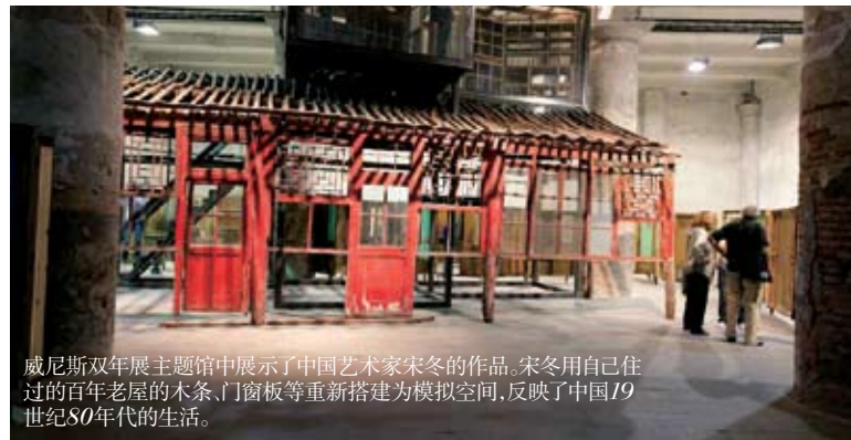
威尼斯双年展主题馆中展示了中国艺术家宋冬的作品。宋冬用自己住过的百年老屋的木条、门窗板等重新搭建为模拟空间,反映了中国19世纪80年代的生活。