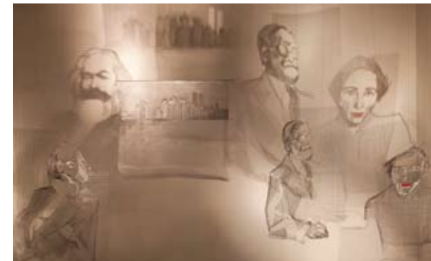
在意大利馆展出的作品。

Black Arch》。而双年展主展场之一的绿园城堡(Giardini)也是异彩纷呈,法国艺术家Loris Gréaud的作品《The Geppetto Pavilion》是一个16.7米长的鲸鱼雕塑,相当抢眼。