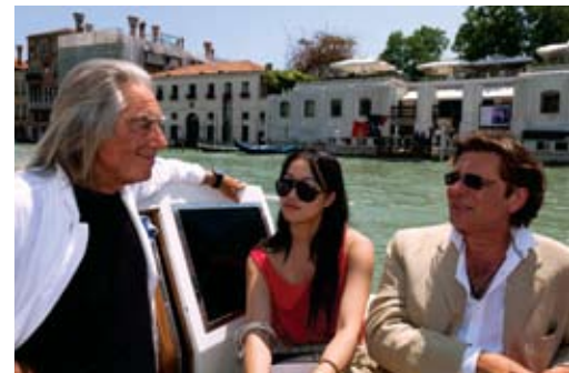
周依与意大利著名艺术家 Fabrizio Plessi 以及策展人 Paolo de Grandis 一起前往在弗朗克缇宫举办的“Glasstress 2011”。