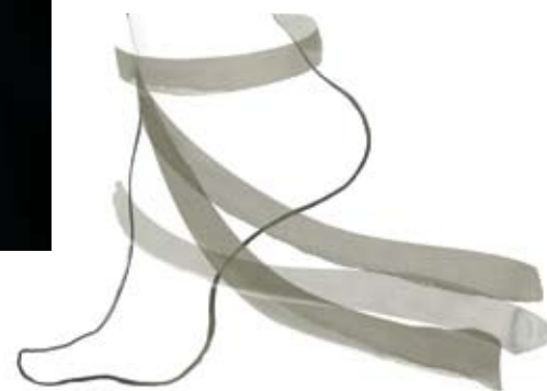
周依作品《Big Feet》,2010,由Pearl Lam Galleries提供。

景:一个瓶子以及一个法瑞尔花瓶,用意大利Murano玻璃将它们制成雕塑,将虚拟的3D动画带到现实生活。预展开幕的第一天,我特别找来一只孔雀作为展览的一部分——孔雀也是《The Greatness》中的一个元素。这只孔雀第一次来到威尼斯,适应了环境之后,它开始在《The Greatness》作品投影前,沿着一条固定的线路缓缓踱步,不时转头看看影片中虚拟出来的自己。