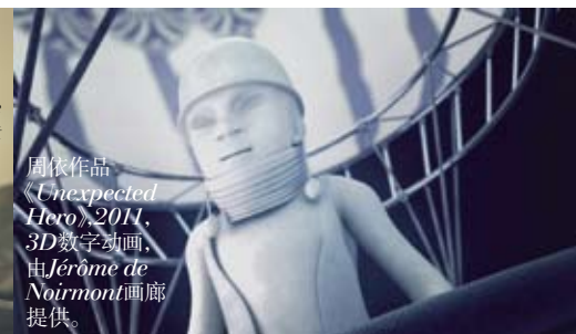
周依作品《Unexpected Hero》,2011,3D数字动画。