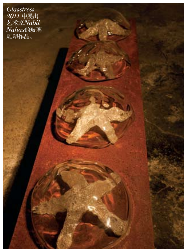
Glasstress 2011 中展出艺术家 Nabil Nahas 的玻璃雕塑作品。

地的艺术家被邀请将自己的短片拿到大屏幕上放映, 形成一个万花筒的效果, 阐述“艺术”与“广告”的关系。