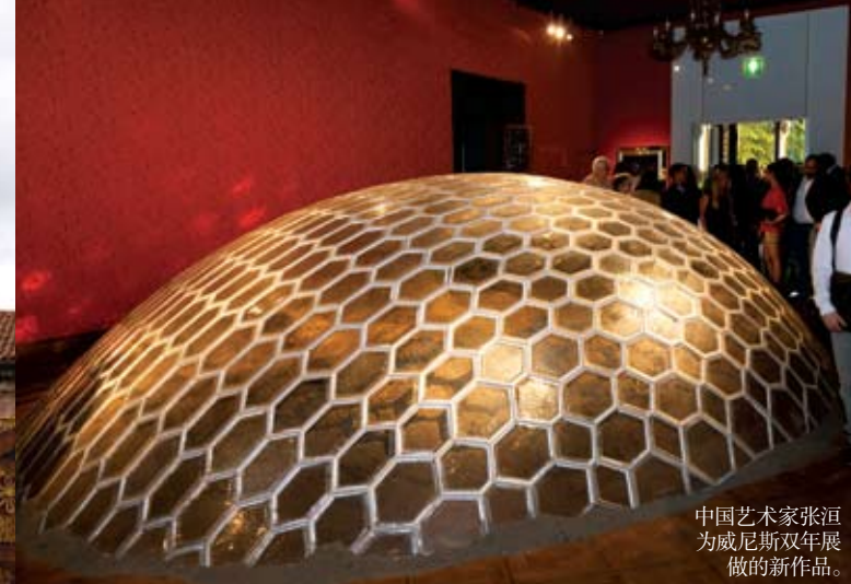
中国艺术家张洹为威尼斯双年展做的新作品。