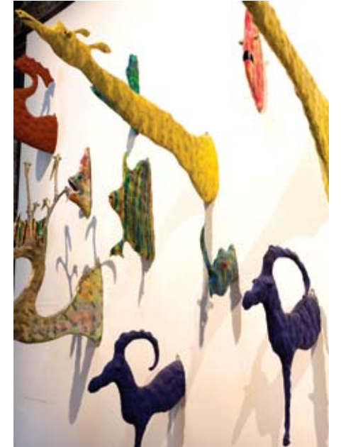
在意大利馆展出的作品。