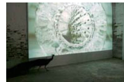
周依作品《The Greatness》,2010。旁边的孔雀在缓缓踱步。