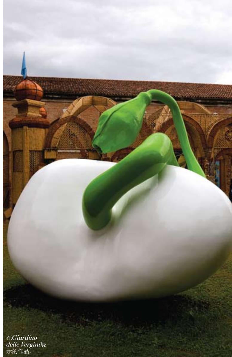
在 Giardino delle Vergini 展示的作品。