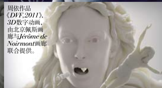
周依作品《DVF,2011》,3D数字动画,由北京佩斯画廊与Jerome de Noirmont画廊联合提供。