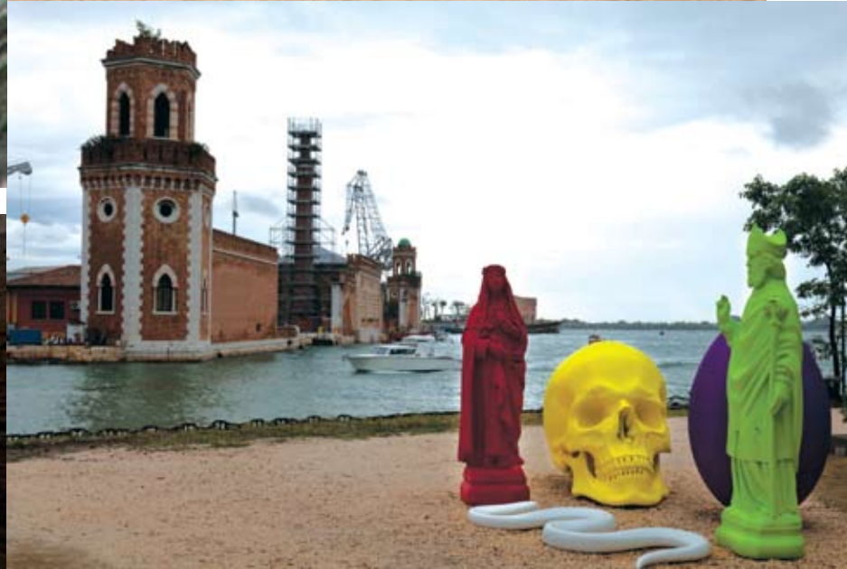
德国艺术家Katharina Fritsch在军械库主题馆的作品《6th Still Life》。