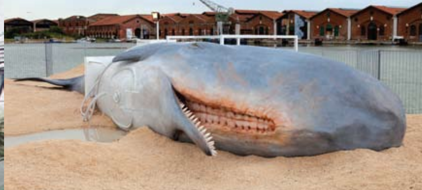
法国艺术家Loris Gréaud的作品《The Geppetto Pavilion》,一个长达16.7米的鲸鱼雕塑。