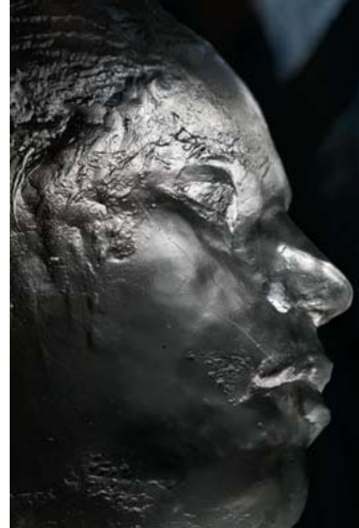
用意大利Murano玻璃制作的Pharrell Vase。

我在个展中展示了2003年-2011年的作品,完整展现了自己从早期模糊无意识的视角,经过寻找自我过程中的过渡时期,最终认识自我、了解未来意义的过程。也正因如此,我将展览现场划分为“过去”、“现在”和“未来”三个空间。“过去”中的3D作品《The Greatness,2010》是对梦想与现实、幻想与疯狂、真实与谎言以及来生的进一步研究。我从这部作品中提取出两个3D动画场