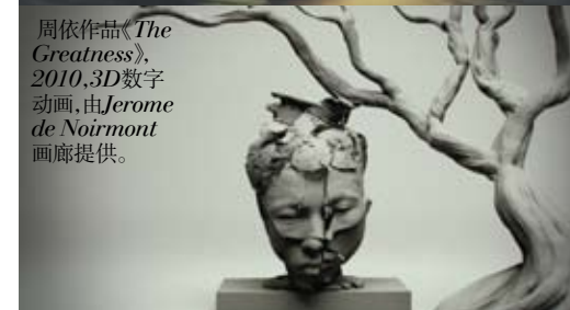
周依作品《The Greatness》,2010,3D数字动画,由Jerome de Noirmont画廊提供。