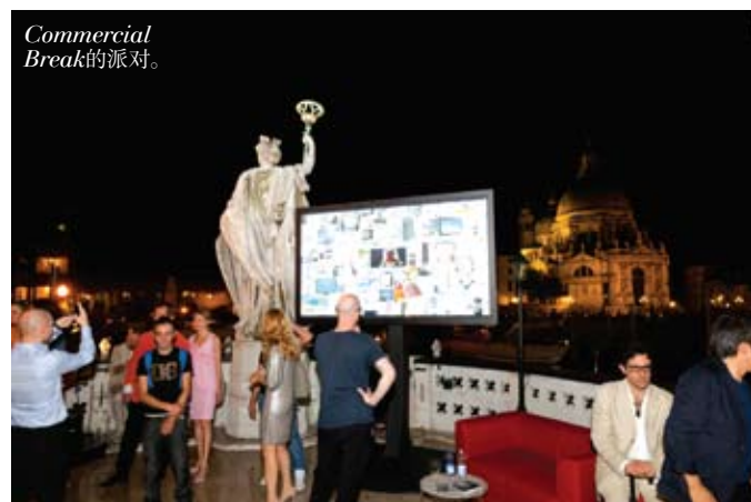
Commercial Break 的派对。