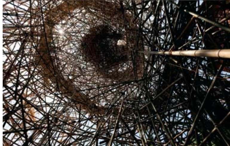
建造中的竹林展,这是内部的竹制螺旋阶梯。